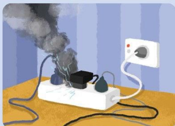
НЕИСПРАВНОСТЬ ЭЛЕКТРОПРОВОДКИ ИЛИ НЕПРАВИЛЬНАЯ ЭКСПЛУАТАЦИЯ ЭЛЕКТРОСЕТИ