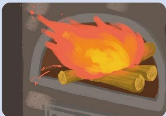
ОТ ПЕЧНОГО ОТОПЛЕНИЯ