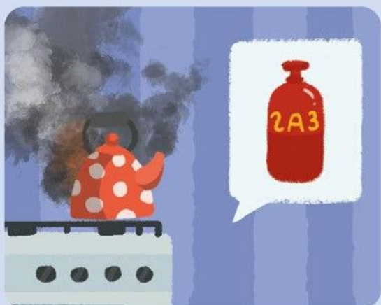
ПОЖАРЫ ОТ БЫТОВЫХ ГАЗОВЫХ ПРИБОРОВ