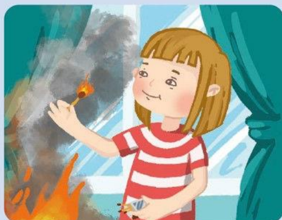
ШАЛОСТЬ ДЕТЕЙ С ОГНЕМ

ПРИ ПОЖАРЕ ЗВОНИ В ЕДИНУЮ СЛУЖБУ СПАСЕНИЯ 112