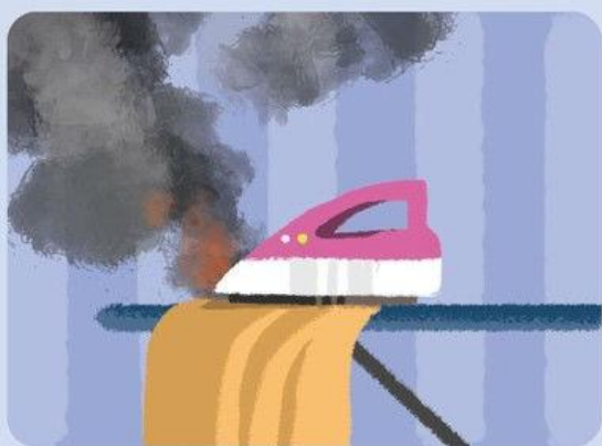
НАРУШЕНИЕ ПРАВИЛ ПОЛЬЗОВАНИЯ ЭЛЕКТРИЧЕСКИМИ ПРИБОРАМИ