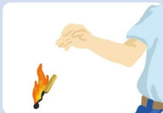
НЕОСТОРОЖНОЕ ОБРАЩЕНИЕ С ОГНЕМ